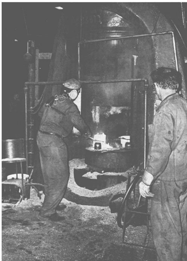
Abbildung 1 Messung der Pulsfrequenz beim Schmieden eines 18,5 kg schweren Schmiedestückes Manipulieren des Schmiedestückes mit einer Zange. Photoelektrische Pulsregulierung am Ohr – den Sender trägt der Schmied auf dem Rücken.

Schmieden eines 7,6 kg schweren Schmiedestückes zusammengestellt. Der Ruhepuls des 26-jährigen Schmiedes betrug 66 Pulse/min. Während der Schmiedezeit wurde die Dauerleistungsgrenze von 30 Arbeitspulsen über dem Ruhepuls überschritten. Der durch die Schmiedearbeit erhöhte Arbeitspuls lag im Durchschnitt um 38 Pulse/min über dem Ruhepuls. Mit der Zunahme der zum Schmieden aufgewendeten Zeit, war eine Erhöhung der Pulsfrequenz festzustellen. Im registrierten Zeitraum von 210 min wurden 204 Stücke gefertigt, was eine durchschnittliche Stückzahl von