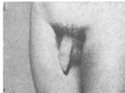
Fig. 3 12½jähriger mit reifen Genitalien

2. Häufig ist der Umstand besonders beeindruckend, wie sehr körperliche und psychische Entwicklung auseinanderklaffen, wie eine sogenannte Dissociation psycho-somatique pubéraise vorliegt. Oft sind das bubenhafte Gesicht, das mit dem ganzen sonstigen kindlichen Gehaben im Einklang steht, und die schon weit ausgebildeten Genitalien besonders beeindruckend: Genitalien eines Mannes bei einem kindlichen Jungen. Natürlich ergibt sich bei solchen Beispielen die prinzipiell wichtige Frage: Was bedeutet das für einen solchen Jungen?