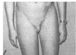
Fig. 4 12½jähriger mit kindlichen Genitalien

3. In den ersten Gymnasialklassen (13. Lebensjahr) befinden sich neben Jungen mit sehr betont männlichen Genitalien andere mit völlig kindlichen Genitalien : Hier zeigt sich das Phänomen der starken Streuung dieser Präzession , ein Phänomen, das früher nicht vorhanden war und das insofern von größter Bedeutung ist, weil vorläufig immer in-homogenere Kollektive als Klassen entstehen, ein Umstand, der für die Schulen nicht ohne Folgen ist.