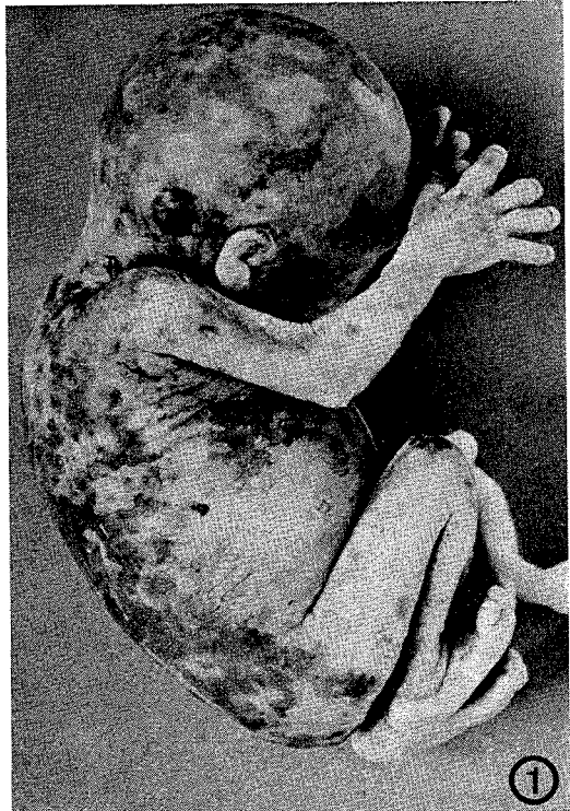
Abb. 1 MK 626. Beachte die pockenähnlichen Pusteln im Bereich der gesamten Haut des Fetus.

Beim ersten Fall (MK 626) handelt es sich um eine 28jährige II-Para, die 52 Tage p.m. wiedergeimpft worden war. Sie zeigte eine heftige Reaktion mit Fieber und starken lokalen Erscheinungen, die nach 8 Tagen abflauten. Die Schwangerschaft verlief unauffällig, bis 85 Tage nach der Impfung plötzlich eine starke Genitalblutung auftrat, die