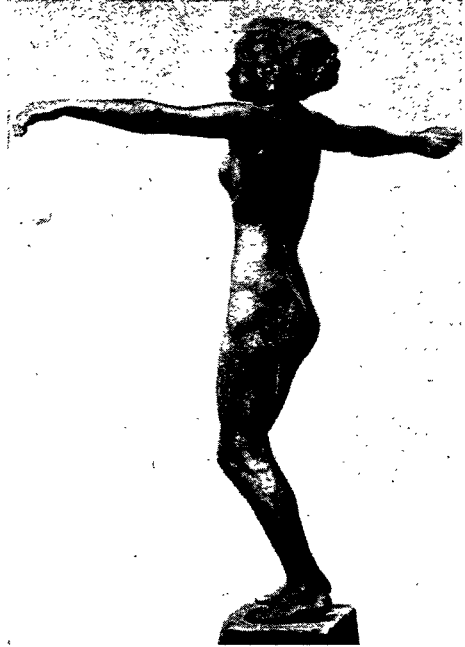
Abb. 6. Frauenfigur in der Kunst der Jahrhundertwende, Georg Kolbe: «Tänzerin» (1905)