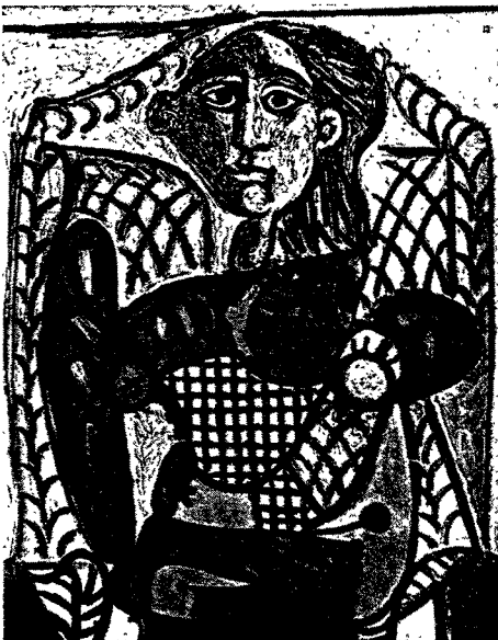
Abb. 3. «Mutter und Kind» in der neuzeitlichen Kunst, Picasso, Mutter und Kind, 1948.