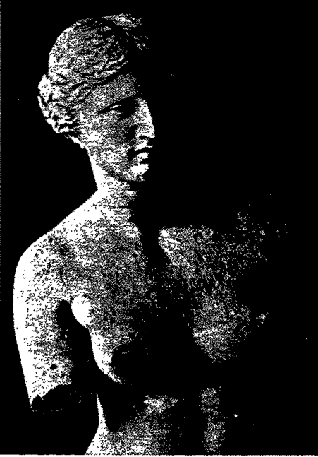
Abb. 5. Frauenfigur in der Kunst der Antike, Venus von Milo (etwa 150 v. Chr.)