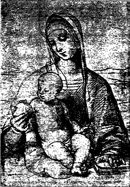
Abb. 1. «Mutter und Kind» in der Kunst des Mittelalters. Raffael, Madonna mit Granatapfel, 1505.