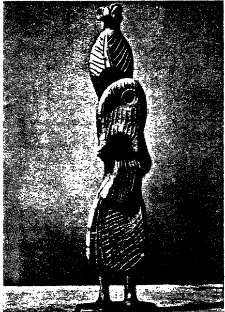
Abb. 7. Figur der neuzeitlichen Kunst, Henry Moore: «Figur» (1952)