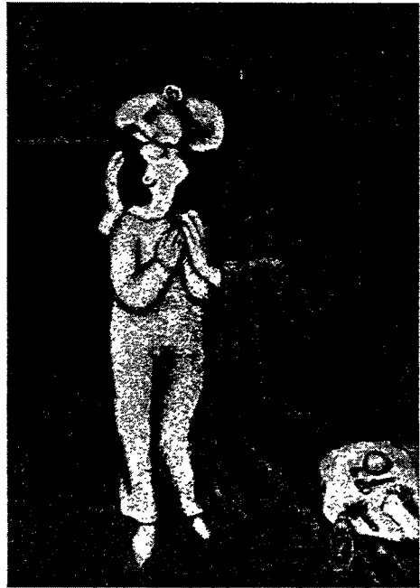
Abb. 2. «Mutter und Kind» in der Kunst der Jahrhundertwende. Picasso, La maternité, 1901.