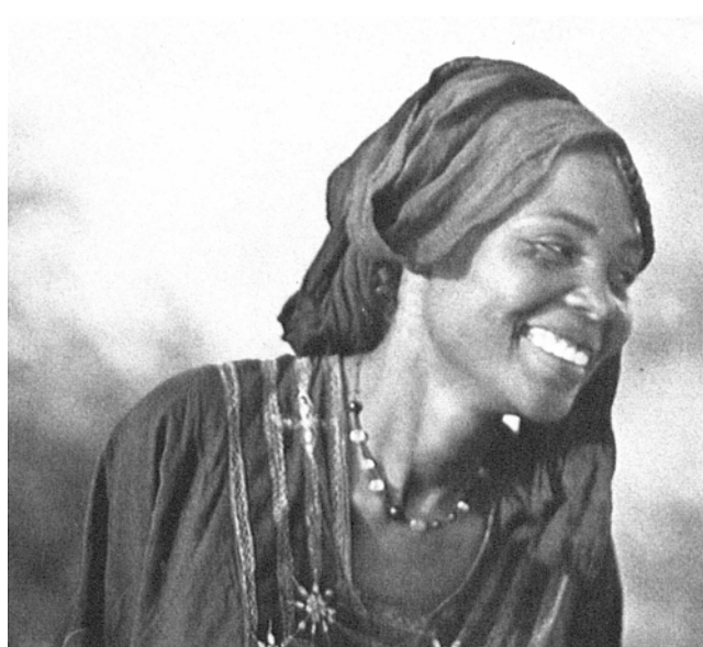
Fig. 1. Famille et Développement , un journal dont chaque numéro est maintenant attendu avec impatience par les Africains francophones de toutes les couches sociales.