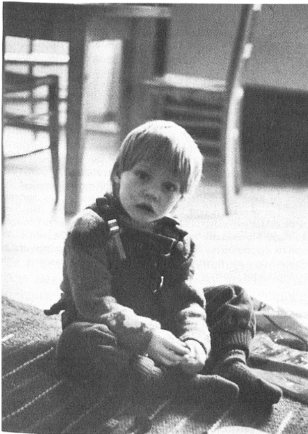
Abb. 1: Kind mit Passivsammler

arbeit mit dem Institut für Hygiene und Arbeitsphysiologie der ETH Zürich Luftqualitätsmessungen mit Passivsammlern durchgeführt. Diese Passivsammler sind kleine Röhrchen, in die Stickstoffdioxid (NO 2 ) proportional zur Aussenluftkonzentration diffundiert. Das absorbierte NO 2 wird photospektrometrisch gemessen. Bisher stehen solche Passivsammler, die erstmals individuelle Messungen in grösserem Umfang zulassen, nur für NO 2 zur Verfügung, in Kürze aber auch für SO 2 . Im Rahmen des Nationalfonds-Projektes wird in Basel NO 2 gemessen, für Zürich sind auch SO 2 -Messungen vorgesehen. Mit dieser Messmethode ist es möglich, bei den geplanten circa 1350 Familien jeweils während 6 Wochen vor dem Fenster der Wohnung (Aussenluft) und im Wohnraum (Innenluft) NO 2 -Messungen durchzuführen. Zudem wird jedes Kind während einer Woche einen solchen Passivsammler tragen, womit die individuelle Belastung des Kindes abgeschätzt werden kann.